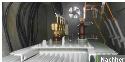
Die Trafostation des Kalkwerkes der Andreas Schorr GmbH & Co. KG

Weitere Informationen finden Sie unter www.bremer-leguil.de