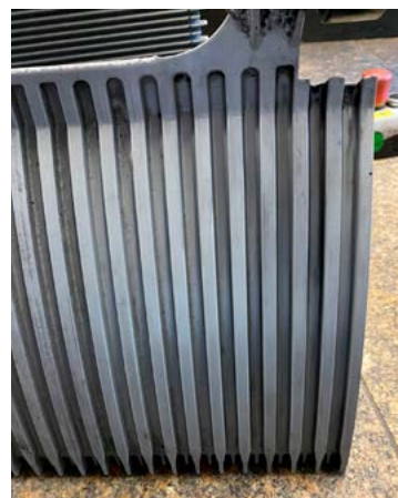
Beispiel für eine Reinigung mit Rivolta B.W.X. an Fahrtreppen