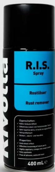
Rivolta R.I.S. Spray Rostlöser

Ob Schraubverbindungen, Scharniere, Bolzen oder Ketten – mit Rivolta R.I.S. Spray lassen sich verrostete und festsitzende Bauteile aller Art schnell und effektiv lösen.