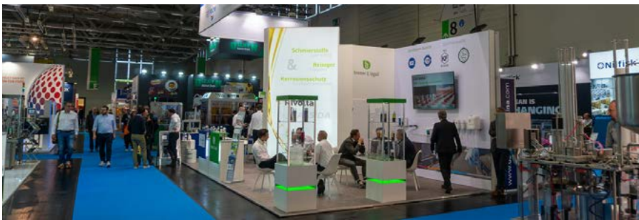
Bremer & Leguil bei der Anuga FoodTec 2022 in Köln

Dieses Jahr werden wir auf folgenden Messen ausstellen: