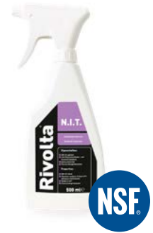
Rivolta N.I.T. Hotmeltentferner

Plattform, mit unseren Kunden und auch neuen Kontakten ins Gespräch zu kommen. Besonders unser Hotmeltentferner Rivolta N.I.T. begeisterte vielfach.